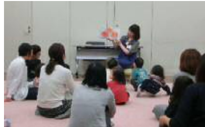
わらべうたとえほんの会（図書館）