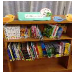
学校図書室内（小学校） ※絵本棚