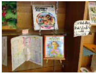
学校図書室内（小学校） ※展示コーナー