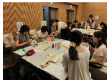
図書館主催の 教職員向けの研修会