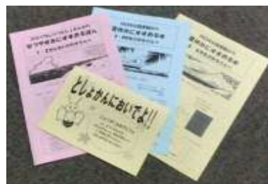
ブックリスト (図書館)