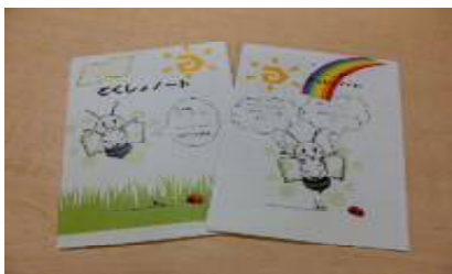
どくしょノート（図書館）