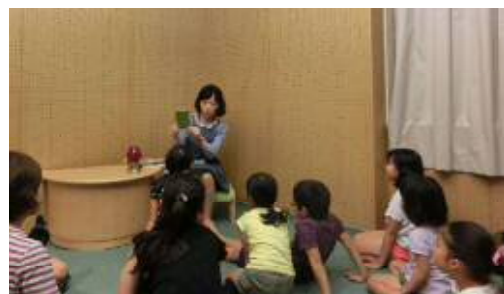
おはなし会（図書館）