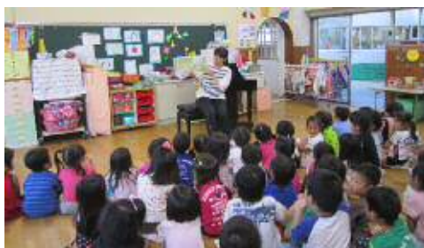
日常の読み聞かせ（幼稚園）